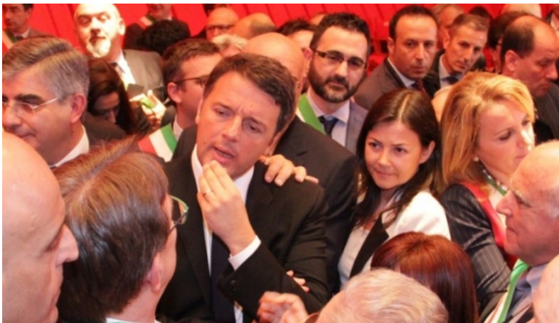
Renzi con i sindaci a L'Aquila dopo la firma del masterplan

L'AQUILA. Un fiume di soldi per l'Abruzzo – un miliardo e mezzo di euro – ma con controlli annunciati e imposti su tempi, modalità e somme erogate. Renzi non vuole scherzi e, d'accordo con D'Alfonso e con i sindaci, ha deciso di controllare e autocontrollarsi. Troppe furbate in passato, troppi fondi inutilizzati, troppe incompiute. Renzi non ha voglia, e neanche tempo, di rischiare. Ci ha messo la faccia e se vuole che l'Italia cambi davvero verso, come ripete in continuazione, vuole la politica del fare e non quella del dire.